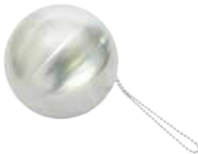
Art. Nr. : LE2106