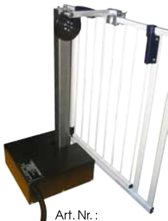
Art. Nr. : LE3100