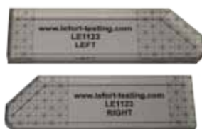
Art. Nr. : LE1123