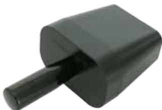
Art. Nr. : LE1108